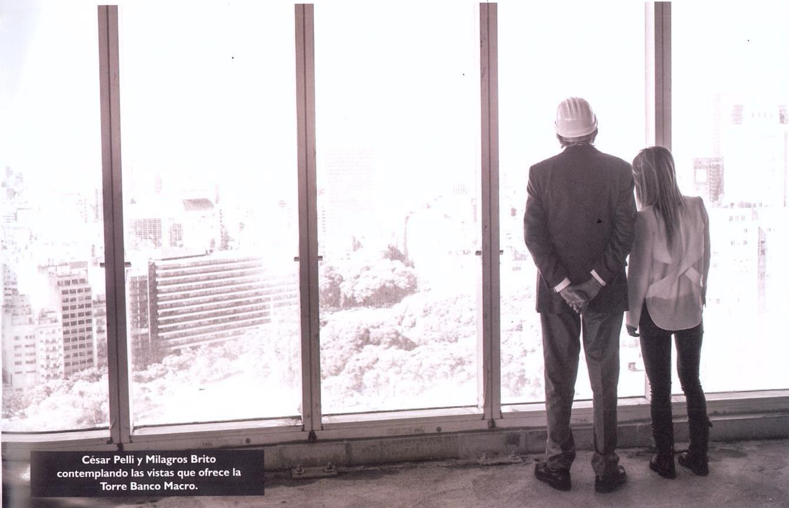
César Pelli y Milagros Brito contemplando las vistas que ofrece la Torre Banco Macro.

Diseñada por César Pelli, uno de los arquitectos más importantes del mundo, y desarrollada por Vizora, la Torre Banco Macro inaugurará en pocos meses sus primeros sectores. El edificio, uno de los más modernos de Latinoamérica, cambió el skyline de la ciudad y promete convertirse en emblema del centro corporativo porteño. En él funcionará la sede central del banco homónimo.