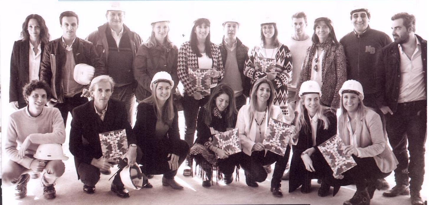
El equipo de Vizora de visita en la Torre.

minuciosidad de artista y compartió anécdotas y recuerdos sobre los inicios del proyecto. Con la amabilidad y la calidez que lo caracterizan, Pelli –también conocido como el Señor de los rascacielos- prometió volver a Buenos Aires cuando la Torre Bancó Macro abra sus puertas.